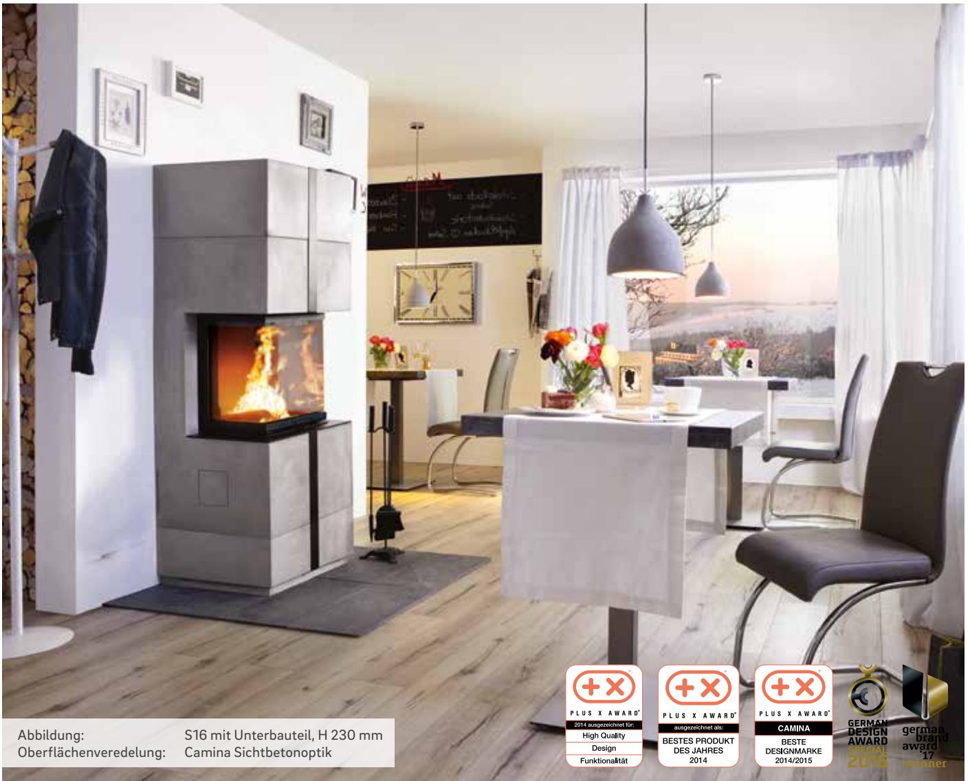
Abbildung: S16 mit Unterbauteil, H 230 mm Oberflächenveredelung: Camina Sichtbetonoptik