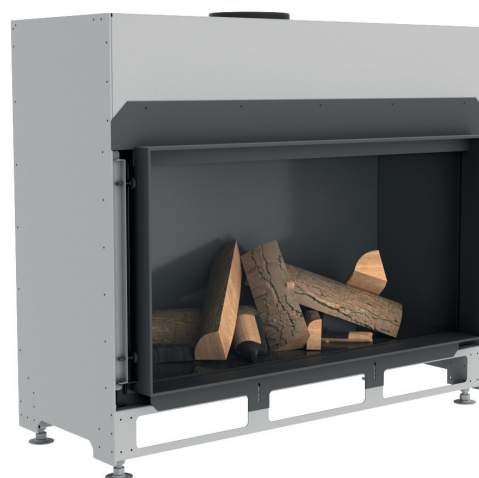
Lina G 100 с футеровкой чёрная сталь (матовая)