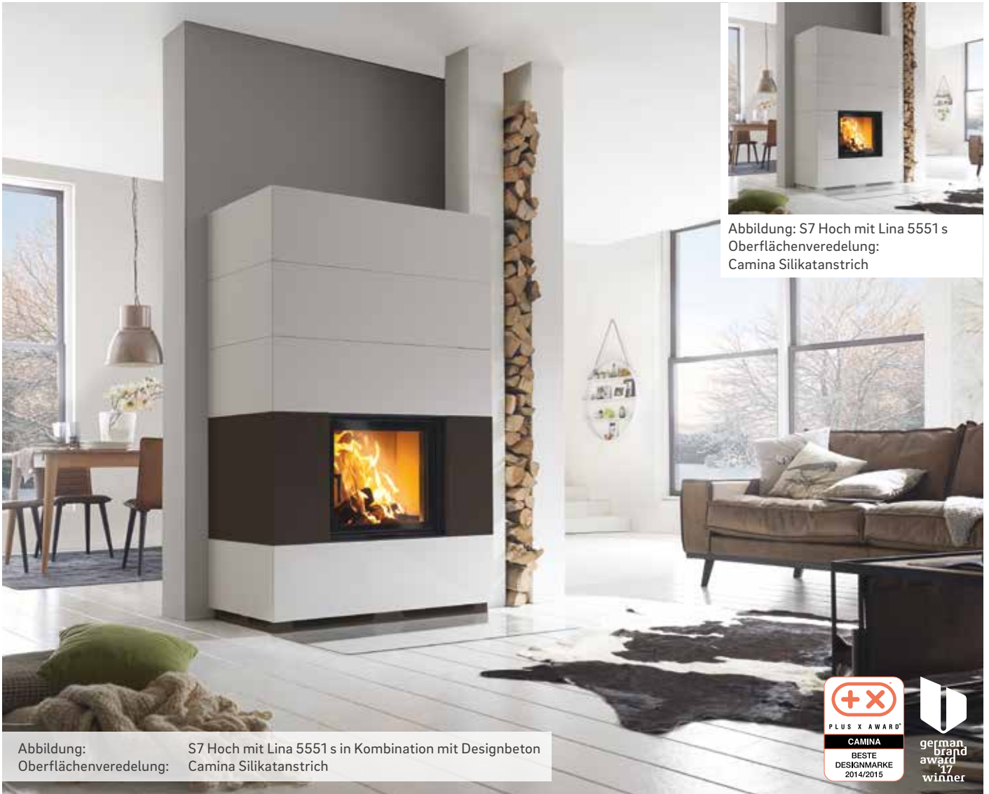
Abbildung: S7 Hoch mit Lina 5551 s Oberflächenveredelung: Camina Silikatanstrich